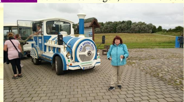
Arkona Express nach Vitt